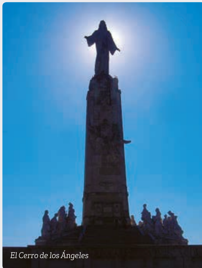
El Cerro de los Ángeles

Jesús, Rei de l'univers, regna des del cor de les persones. Tot i que ell és el rei, és a la porta del cor de cada persona, trucant com un pidolaire, perquè el cor solament es pot obrir per dins: Mira, sóc a la porta i truco. Si algú m'escolta i obre la porta, entraré a casa seva i menjaré amb ell (Ap 3,20). Tothom, en un moment o altre de la seva vida, sent en el seu cor els trucs suaus i penetrants