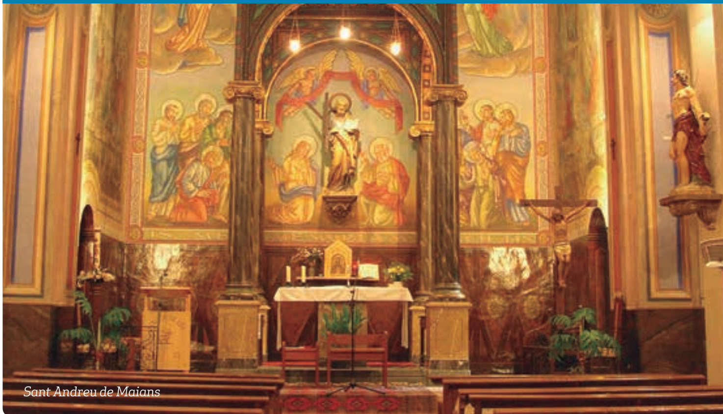
Sant Andreu de Maians

p6 — Publicat en català el document final del Sínode sobre els joves