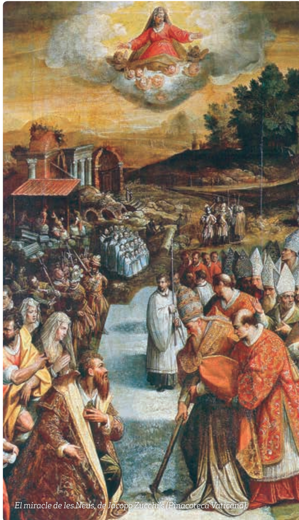
El miracle de les Neus, de Jacopo Zucchi's (Pinacoteca Vaticana).