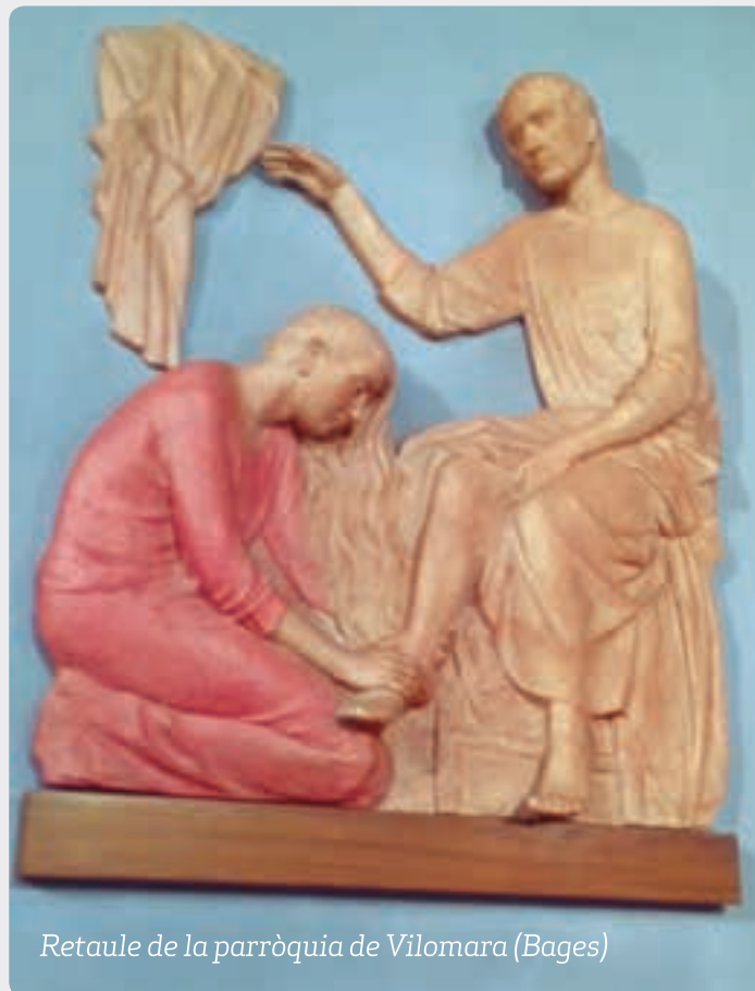
Retaule de la parròquia de Vilomara (Bages)

Però també hem de reconèixer el treball evangelitzador i d'acompanyament de dones creients, plenes d'amor a Déu, amb les paraules de consell i d'esperança, sobretot a les noies joves i les mares també joves. En les nostres parròquies sempre serà poc el que hem d'agradir i lloar del treball de les catequistes. Moltes d'elles amb anys i anys de servei generós i desinteressat, però ple d'amor i de lliurament. I no puc oblidar les mestres i professores