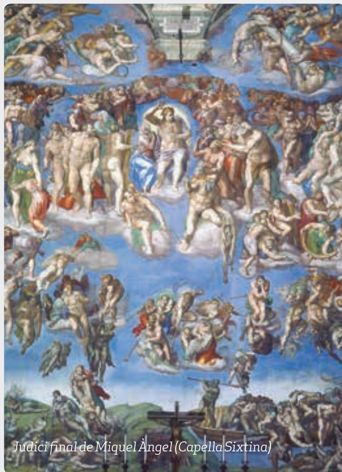
Judici final de Miquel Àngel (Capella Sixtina)

De fet, en l'evangeli que es proclama en aquesta solemnitat, Jesús es relaciona amb els més pobres. El qui s'asseurà al seu tron gloriós és el mateix que s'identifica —de manera sorprenent— amb el qui tenia fam, tenia set, era foraster, veiéreu despullat, estava malat, era a la presó . A Jesús li pertany tota la reialesa, tota autoritat i tot poder. Ell que ha sofert la seva Passió i la seva mort en Creu, ha estat glorificat i s'ha assegut a la dreta del Pare. Els cristians contemplem des de la fe la senyoria de Crist sobre el món i la història. Tota reialesa d'aquest món passa. Tot poder finirà. Jesús s'asseurà en el seu tron gloriós, essent implacable amb els poderosos d'aquest món, i pronunciarà el judici universal que posarà fi a tota la història humana. Aquest Jesús mateix, ple de glòria, és el qui, mentre caminem per aquest món, ens demana de tenir els ulls del cor ben oberts per a descobrir-lo en els germans