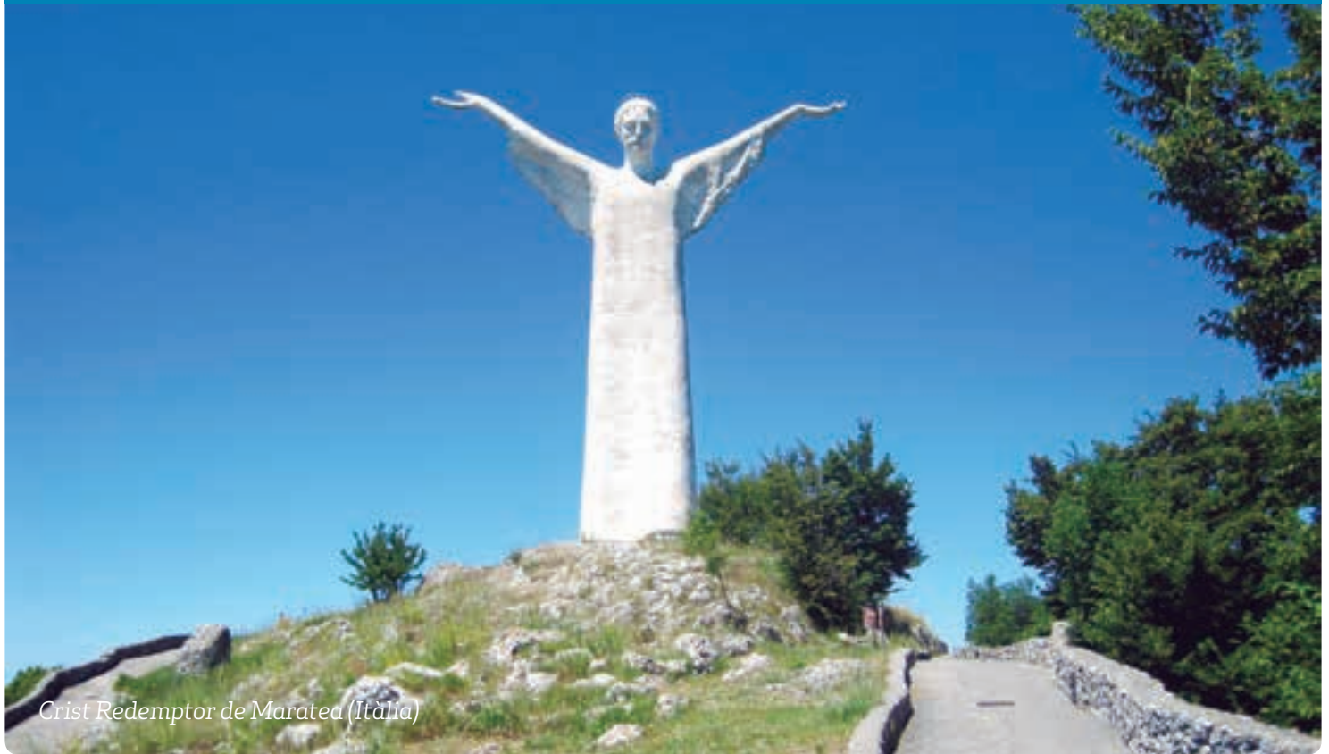
Crist Redemptor de Maratea (Itàlia)

p6 — La figura del papa Joan Pau I, d'actualitat