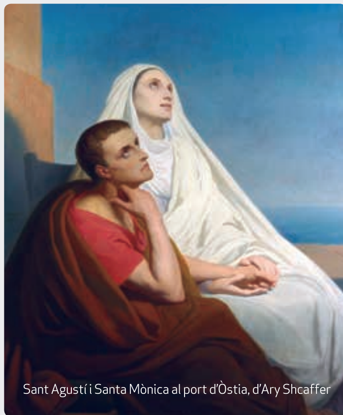
Sant Agustí i Santa Mònica al port d'Òstia, d'Ary Shcaffer

En aquesta tessitura, l'únic que resta és, a imitació de santa Mònica, pregar i patir. El qui estima pateix. El qui estima, en quant vol el bé de la persona estimada, no deixa de maldar en el seu cor a fi que aquesta ho aconseguixi. La font de l'amor que s'expressa en el sofriment és Déu mateix. Tant ha estimat Déu el món, que ha enviat al seu Fill únic , ens diu Jesús (Jn 3,16). I ja sabem quin és aquest lliurament!