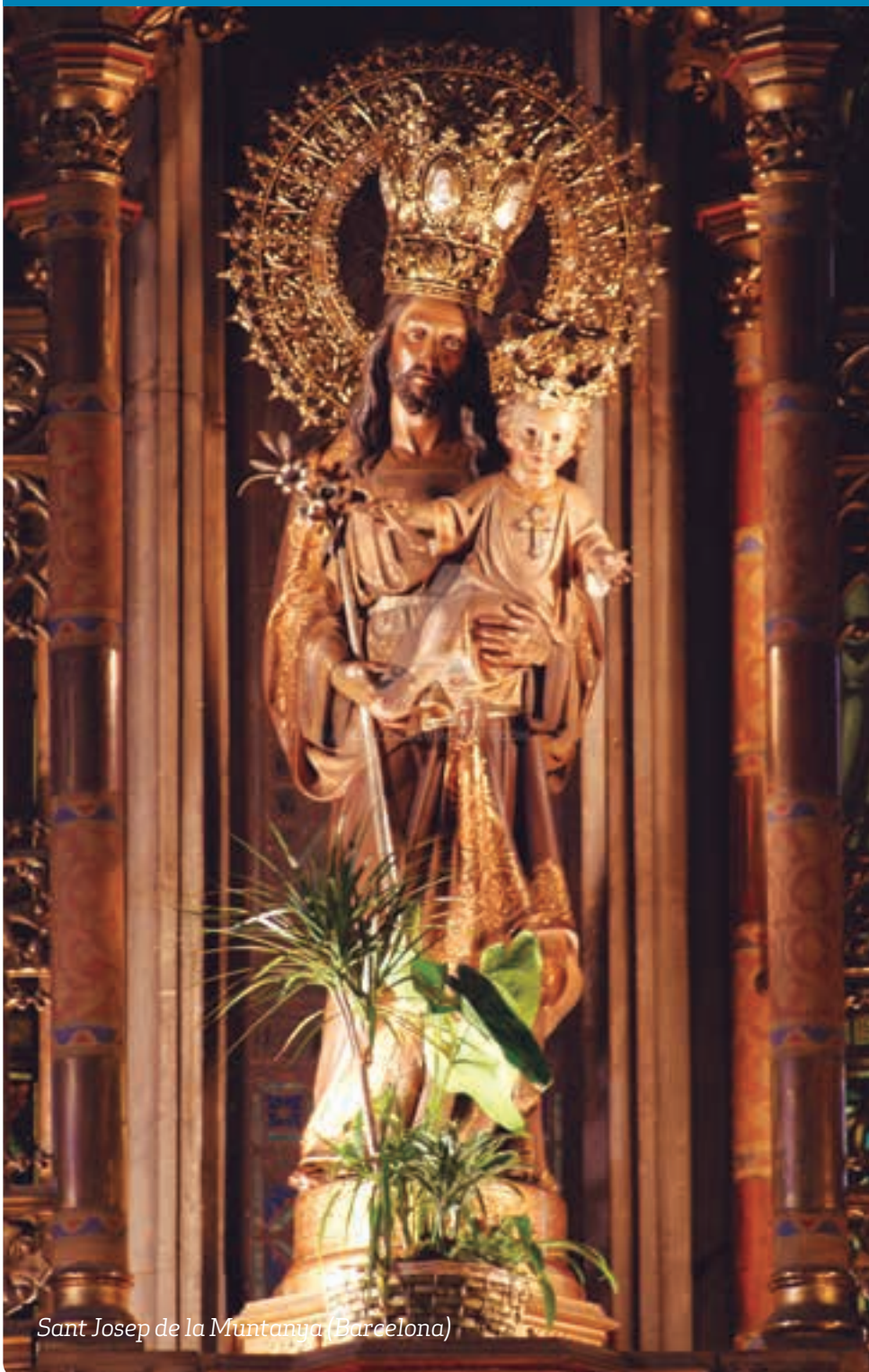
Sant Josep de la Muntanya (Barcelona)

p6, p7 i p8 —Avui, Dia del Seminari 2017