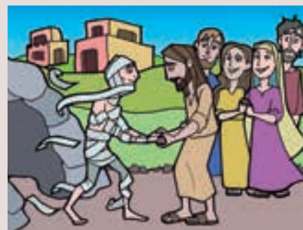
5è diumenge Quaresma

Il·lustracions de l’àlbum Jesús, diumenge ens veiem , de l’Editorial Família de Jesús