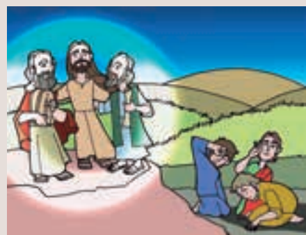
2n diumenge Quaresma