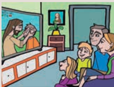
4t diumenge Quaresma