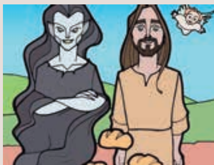
1r diumenge Quaresma