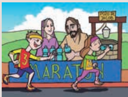
3r diumenge Quaresma