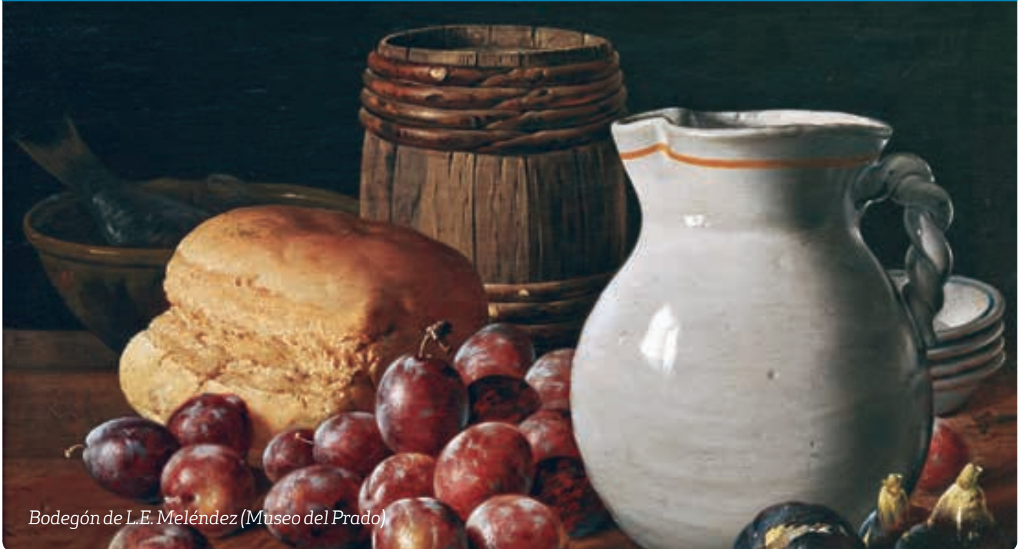
Bodegón de L.E. Meléndez (Museo del Prado)

p6 —Missatge del Sant Pare per a la Quaresma 2017