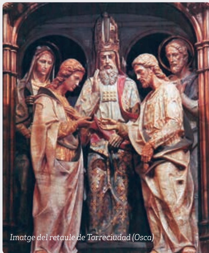
Imatge del retaule de Torreciudad (Osca)

Maria i Josep es van esposar per elecció divina; és el Senyor el qui els ha posat davant per davant i les seves esposalles són de Déu. El matrimoni de Josep i Maria té una gran missió d'amor; però un amor molt més gran: l'amor de Déu per la humanitat. A mi m'agrada de pensar que, tant en Maria com en Josep, el Senyor fa néixer desitjos grans, que ell mateix aconsegueix amb escriure. En Maria, cosa estranya en el poble jueu, hi ha un desig de virginitat. Deixant-se portar per Déu es compromet en matrimoni amb Josep. Però Déu, per a qui no hi ha res impossible (Lc 1,37), li fa el do de la virginitat i el de la maternitat. Perquè el Fill que d'ella naixerà no pot dir a ningú «pare» amb tota propietat si no és al Pare etern. Per això la pregunta de Maria a l'àngel: Com podrà ser això, si jo sóc verge? (Lc 1,34), solament pot néixer d'una dona compro-