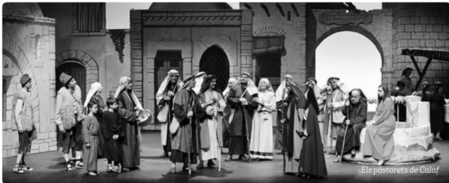
Els pastorets de Calaf