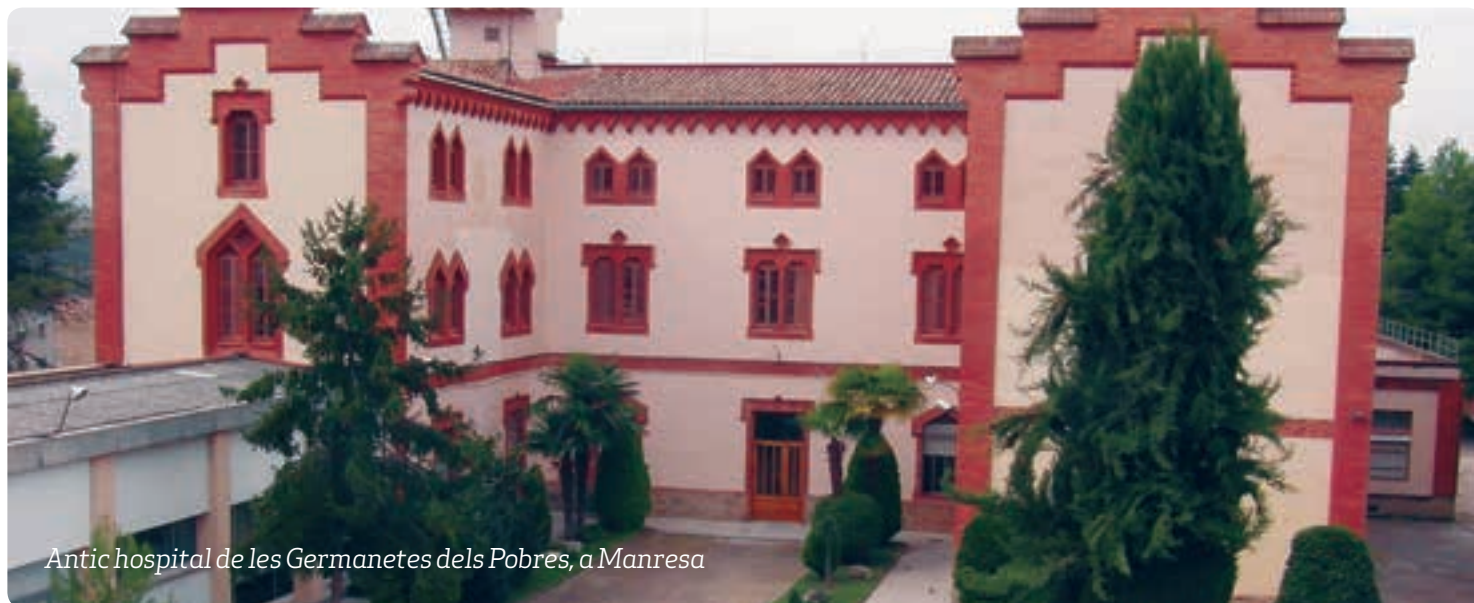
Antic hospital de les Germanetes dels Pobres, a Manresa

«Acollida de persones refugiades a Vic: balanç dels tres mesos d'estada a la ciutat». Amb aquest títol l'Ajuntament de Vic, Dianova i el Seminari de Vic van organitzar una jornada informativa al Seminari vigatà el dimecres 14 de desembre.