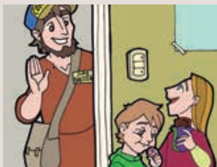
1r diumenge Advent