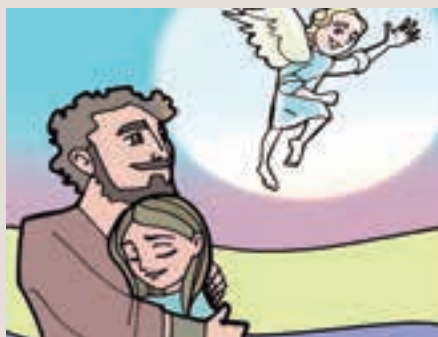
4t diumenge Advent