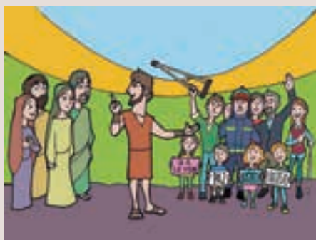
3r diumenge Advent