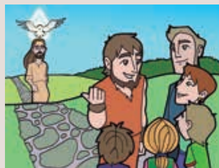
2n diumenge Advent