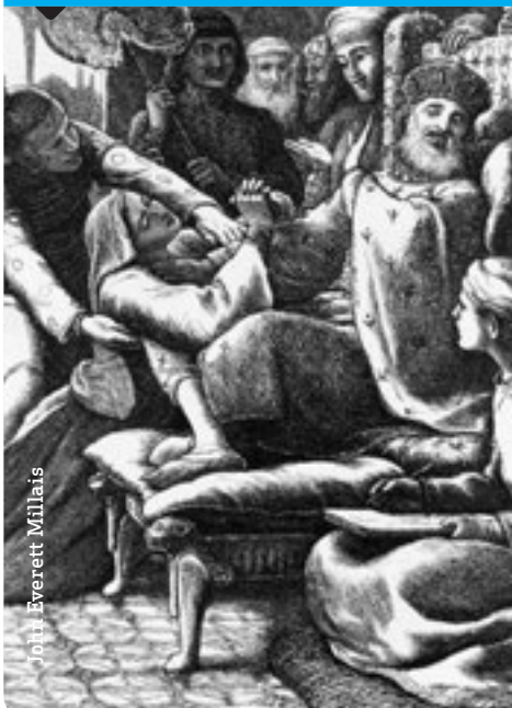
El jutge injust i la viuda inoportuna (1864).

En una paràbola Jesús explica que una pobra viuda, a còpia d'insistència, aconsegueix que un jutge endurit li resolgui el seu plet. Per contrast, afegeix: «Creieu que Déu no farà justícia als seus elegits que la hi reclamen de nit i de dia?» Hem de pregar, doncs, sense perdre mai l'esperança, encara que Déu es faci esperar.