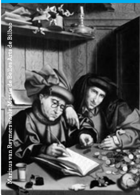
Marinus van Reymerswaele, Museu de Belles Arts de Bilbao