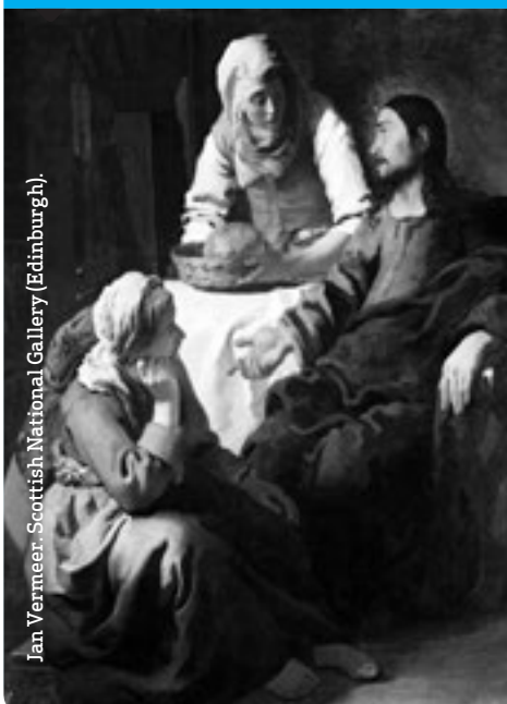
Jan Vermeer. Scottish National Gallery (Edinburgh).