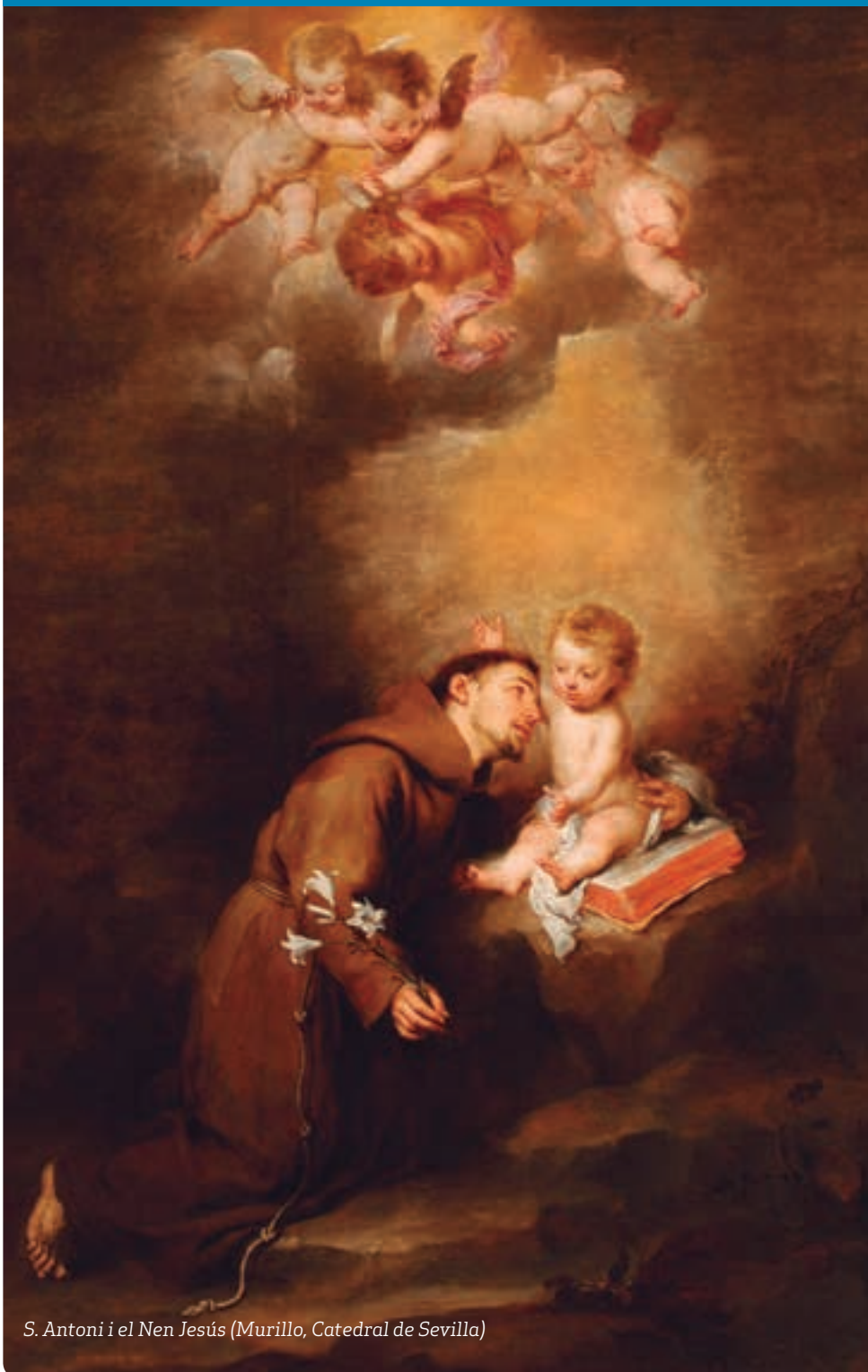
S. Antoni i el Nen Jesús (Murillo, Catedral de Sevilla)