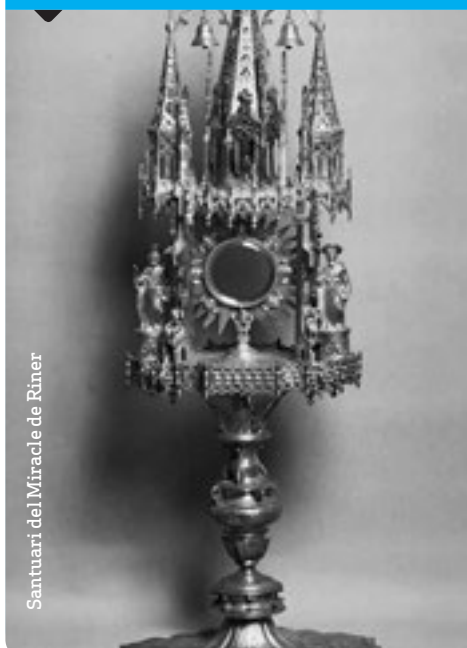
Santuari del Miracle de Riner