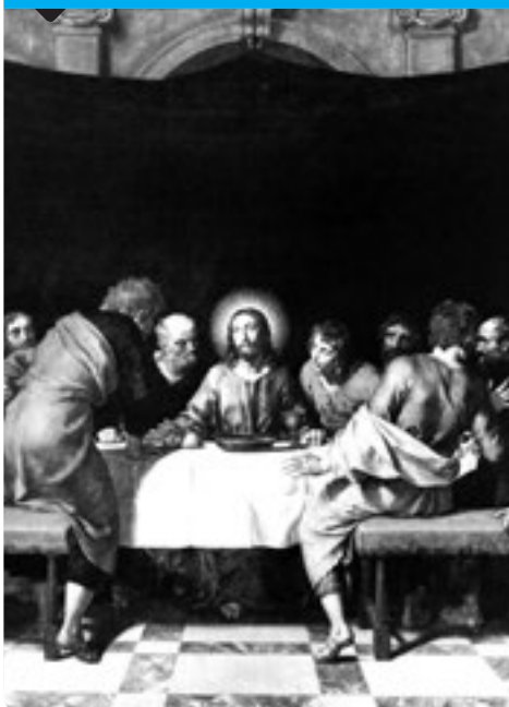
L'Últim Sopar (1618). Frans Pourbus el Jove. Musée du Louvre (París).

Demanaren a l'amic de qui era. Respongué: —De l'amor. —De què ets? —D'amor. —Qui t'ha engendrat? —Amor. —On nasqueres? —En amor. —Qui t'ha nodrit? —Amor. —De què vius? —D'amor. —Com te dius? —Amor. —D'on vénis? —D'amor. —On vas? —A amor. —On estàs? —En amor — [...]. (Del Llibre d'Amic i Amat de Ramon Llull).