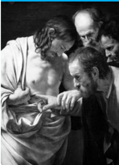
La incredulitat de sant Tomàs (1602-03). Caravaggio. Sanssouci Picture Gallery (Potsdam).

Els cristians ens reunim, sabent que Jesús es fa present en l'assemblea. Però, de vegades, surt en nosaltres l'home positivista que, com Tomàs, es resisteix a creure. Voldríem proves i se'ns ofereixen signes. Llavors Jesucrist ens invita a experimentar el seu amor, a veure-hi amb els ulls del cor i a gustar la felicitat de creure sense veure.