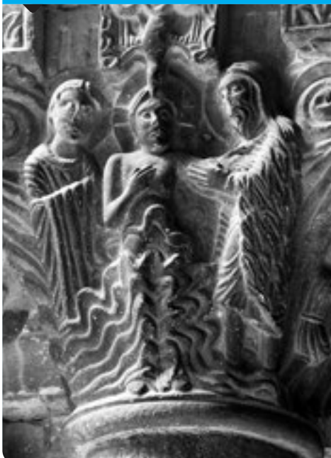
Baptisme de Jesús (s. XII). Capitell del claustre del monestir de Santa Maria de l'Estany (l'Estany).

El baptisme de Jesús al riu Jordà és l'inici de la seva vida pública. Joan el va precedir obrint-li camí. Jesús és ja l'acompliment de les promeses. Ungit de l'Esperit Sant, se'ns presenta com el Fill estimat en el qui el Pare s'ha complagut i a qui cal seguir.