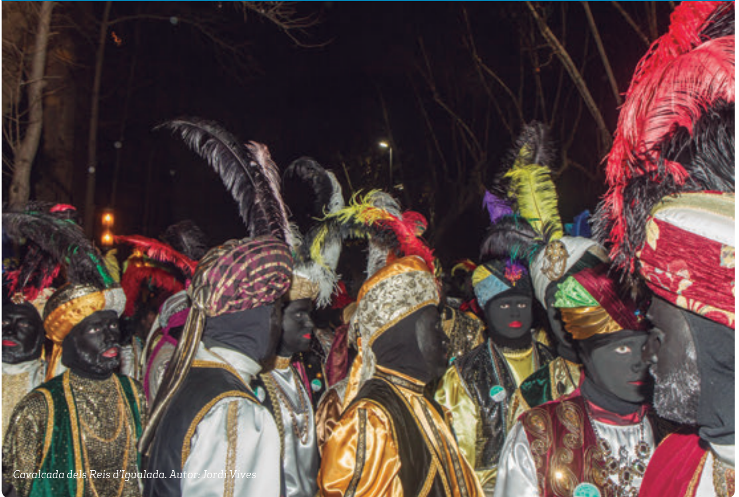
Cavalcada dels Reis d'Igualada. Autor: Jordi Vives

p6 –Els bisbes aproven un nou pla pastoral