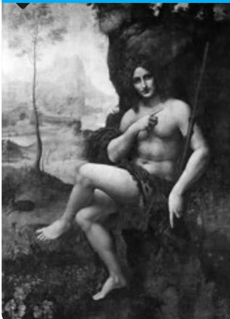
Sant Joan al desert (1510-15). Leonardo da Vinci. Museu del Louvre (París).

«El qui és la Paraula es va fer home i plantà entre nosaltres el seu tabernacle.» El Fill de Déu, doncs, s'ha fet carn, germà nostre. Si hi creiem i el seguim, ens concedeix poder ser fills de Déu.