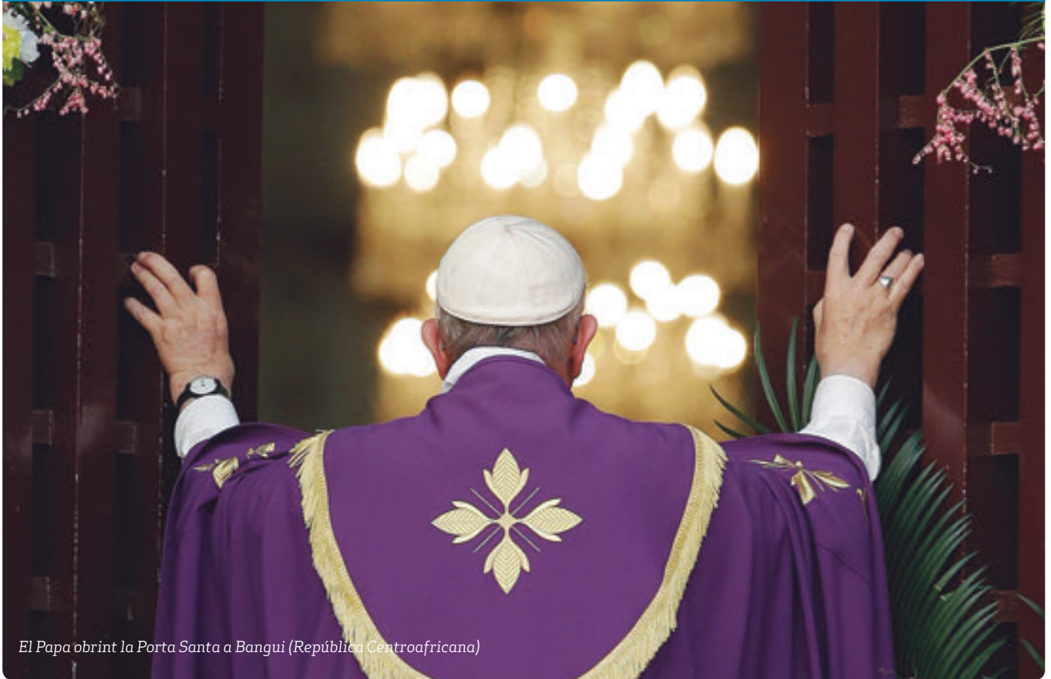
El Papa obrint la Porta Santa a Bangui (República Centroafricana)

p6 – Mig milió de persones ateses per Càritas