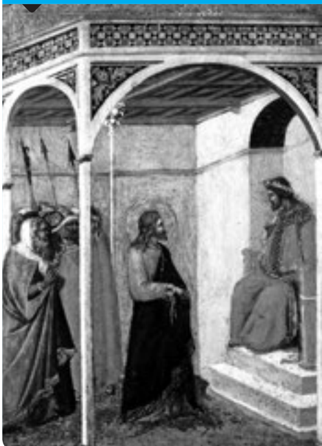
Crist davant Pilat (1330). Pietro Lorenzetti. Pinacoteca Apostòlica del Vaticà.

Jesús digué a Pilat: «Jo sóc rei. La meva missió és la de ser un testimoni de la veritat; per això he nascut i per això he vingut al món: tots els qui són de la veritat escolten la meva veu.» Reconèixer Jesucrist com a rei comporta ser de la veritat i escoltar la seva veu. La veritat és la revelació del Pare, manifestada per Jesucrist, aclarida per l'Esperit i acollida en la fe.