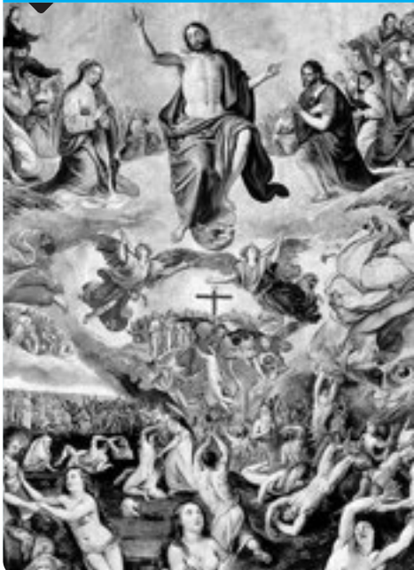
Judici final (1570). Marten de Vos. Museo de Bellas Artes de Sevilla.

Les al·lusions bíbliques a la fi dels temps són el teló de fons que emmarca tot el curs de la història i que il·lumina també el nostre present. No ens hem de deixar portar pel catastrofisme. Enmig de la tribulació, Jesucrist és a les portes i continua donant sentit a viure, d'acord amb l'Evangeli, lluitant per la construcció d'un món més humà.