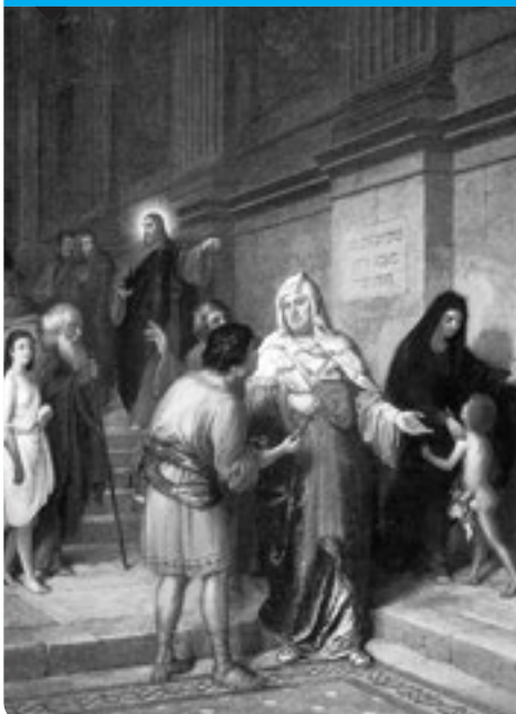
L'ofrena de la vídua (1876). João Zeferino da Costa.

Tendim a l'ostentació, a fer-nos valer el bé que fem encara que no ens costi gaire. Jesús, en canvi, valora més la qualitat que la quantitat. Les seves matemàtiques són diferents. No lloà els qui havien donat molt del que els sobrava, sinó la dona, viuda i pobre, que ho donà tot perquè estimava Déu i se'n fiava. Les aparences enganyen.