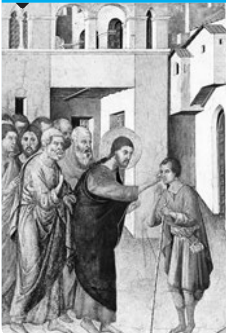
Crist cura a l'home cec (1308-11). Duccio di Buoninsegna. National Gallery (Londres).

Bar-timeu coneix la pròpia misèria i te notícia de Jesús com a Messies compassiu. Quan Jesús passa, el crida. Jesús li demana què vol. Ell respon: «Mestre, feu que hi vegi.» Jesús li parla de fe i de salvació. Com el cec de Jericó, tenim necessitat de veure-hi. Adrecem-nos a Jesús i manifestem-li el nostre desig de llum. Ell il·luminarà la mirada interior del nostre cor perquè, plens de joia, el seguim pel camí.