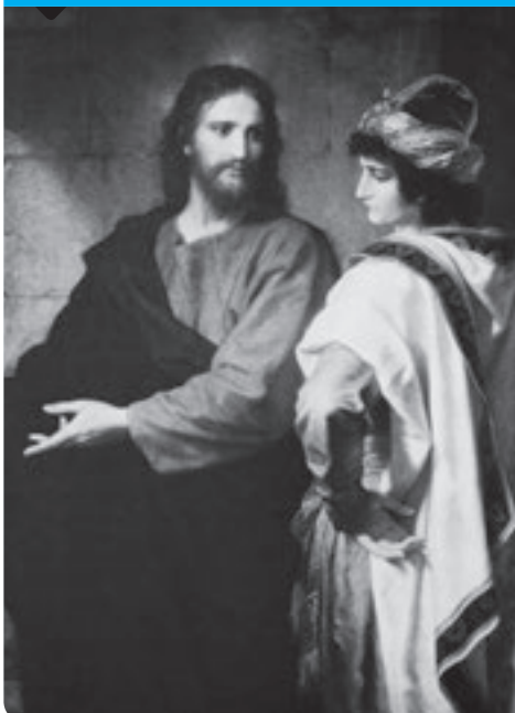
Crist i el jove ric (1889). Heinrich Hofmann. Església de Riverside (Nova York).

Als ulls de Jesús, ser ric és un mal negoci. El consell que dona al jove ric no és una recepta per a tothom. Però el seu esperit sí que l'hem de seguir tots: fer passar l'honestetat, l'amor als altres i les exigències del bé comú, de la pau i de la justícia per damunt dels nostres interessos egoistes. L'afany de riquesa porta als enfrontaments i a la tristesa. La generositat és camí de llibertat i de joia.