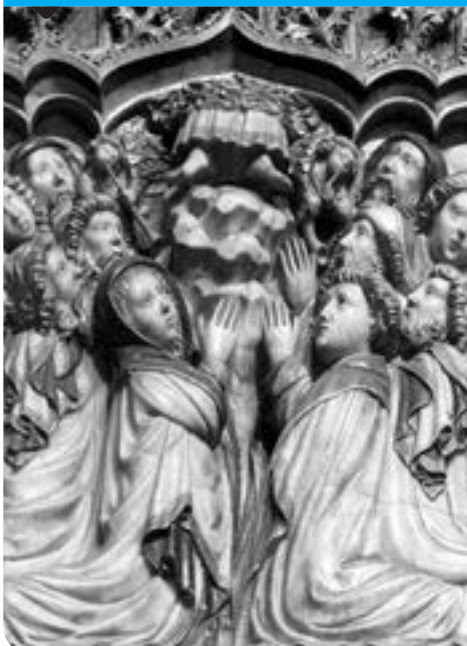
Escena del retaule major de la catedral de Sant Pere de Vic. Pere Oller. 1420-28.

No estem sols. Jesús promet que serà amb nosaltres cada dia fins a la fi del món. L'Ascensió de Jesús no és un allunyament, sinó el començament d'una nova presència, no visible ni palpable, però més pròxima i més vital. Perquè Jesús és a la glòria del Pare, el sabem tan proper a nosaltres.