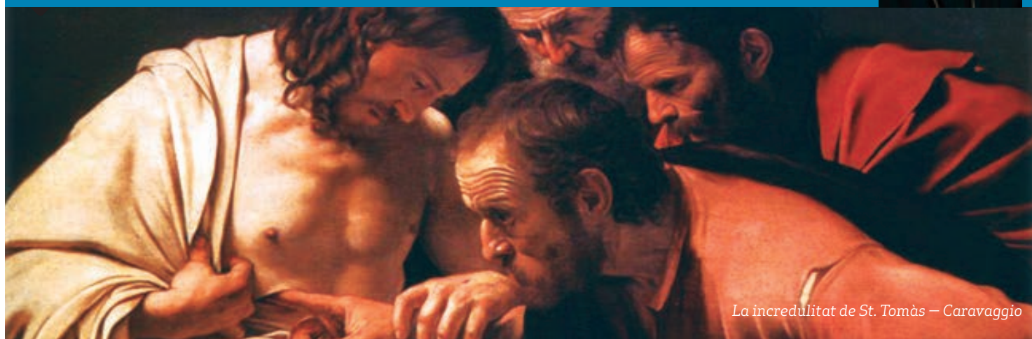
La incredulitat de St. Tomàs – Caravaggio

Fou sant Joan Pau II, papa, qui va instituir que el diumenge segon de Pasqua fos també anomenat Diumenge de la Divina Misericòrdia. En la lectura de l'evangeli d'aquest dia apareixen aquestes paraules de Jesús: Rebeu l'Esperit Sant. A tots aquells a qui perdonareu els pecats els quedaran perdons, però mentre no els perdonareu, quedaran sense perdó (Jn 19,22-23), i, per tant, s'expressa amb claredat la relació que hi ha entre el misteri pasqual i el perdó dels pecats. De fet, no hi ha Pasqua autèntica sense el perdó dels pecats. En temps de Pasqua els batejats reben el perdó de Déu i, els ja batejats, vivim l'alegria de la vida nova, amb la certesa que la misericòrdia de Déu sempre ens acompanya.