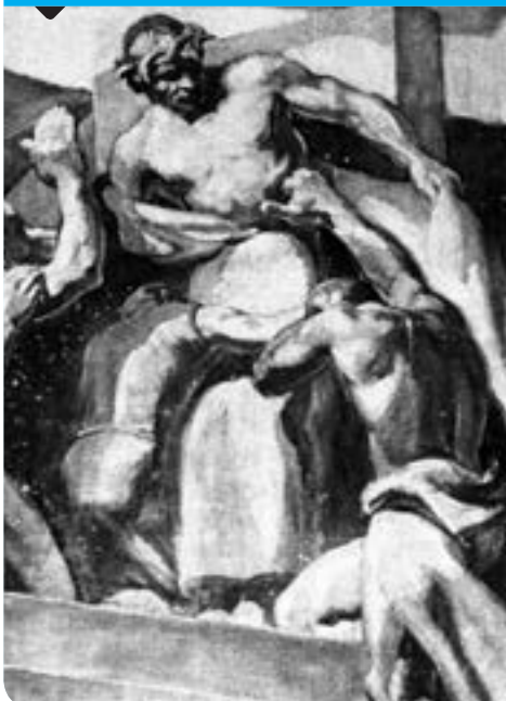
Dubte de Tomàs. Pintures murals de la catedral de Sant Pere de Vic. Josep Maria Sert, 1940-45.

De vegades ens surt el racionalista que portem a dintre i que es resisteix a creure. Com Tomàs, voldríem proves i se'ns ofereixen signes. Jesucrist ens convida a entrar en la seva vida, a no defugir l'experiència interior del seu amor, a veure-hi amb els ulls del cor i a gustar la felicitat de creure sense haver vist.