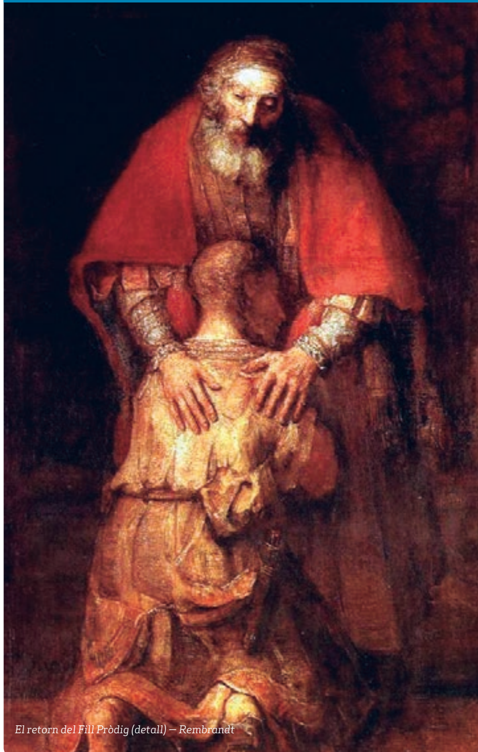
El retorn del Fill Pròdig (detall) — Rembrandt

El Jubileu consisteix en un perdó general, una indulgència oberta a tots, amb la possibilitat de renovar la relació amb Déu i amb el proïsme.