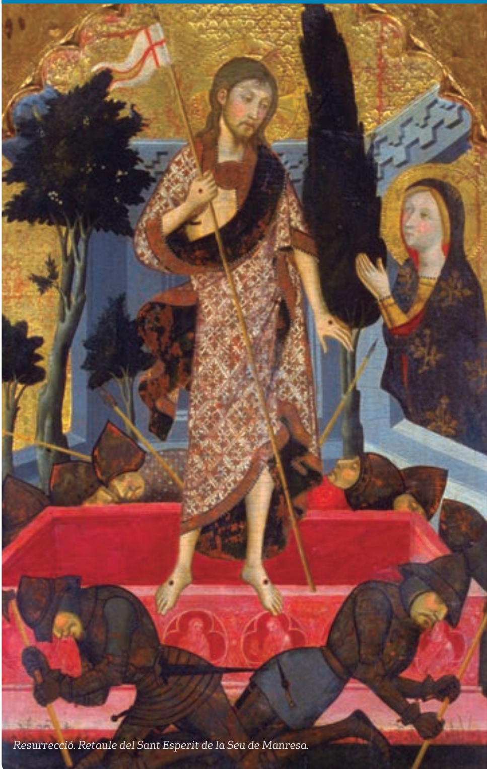
Resurrecció. Retaule del Sant Esperit de la Seu de Manresa.

p6 – Celebrada la Jornada de professors de religió