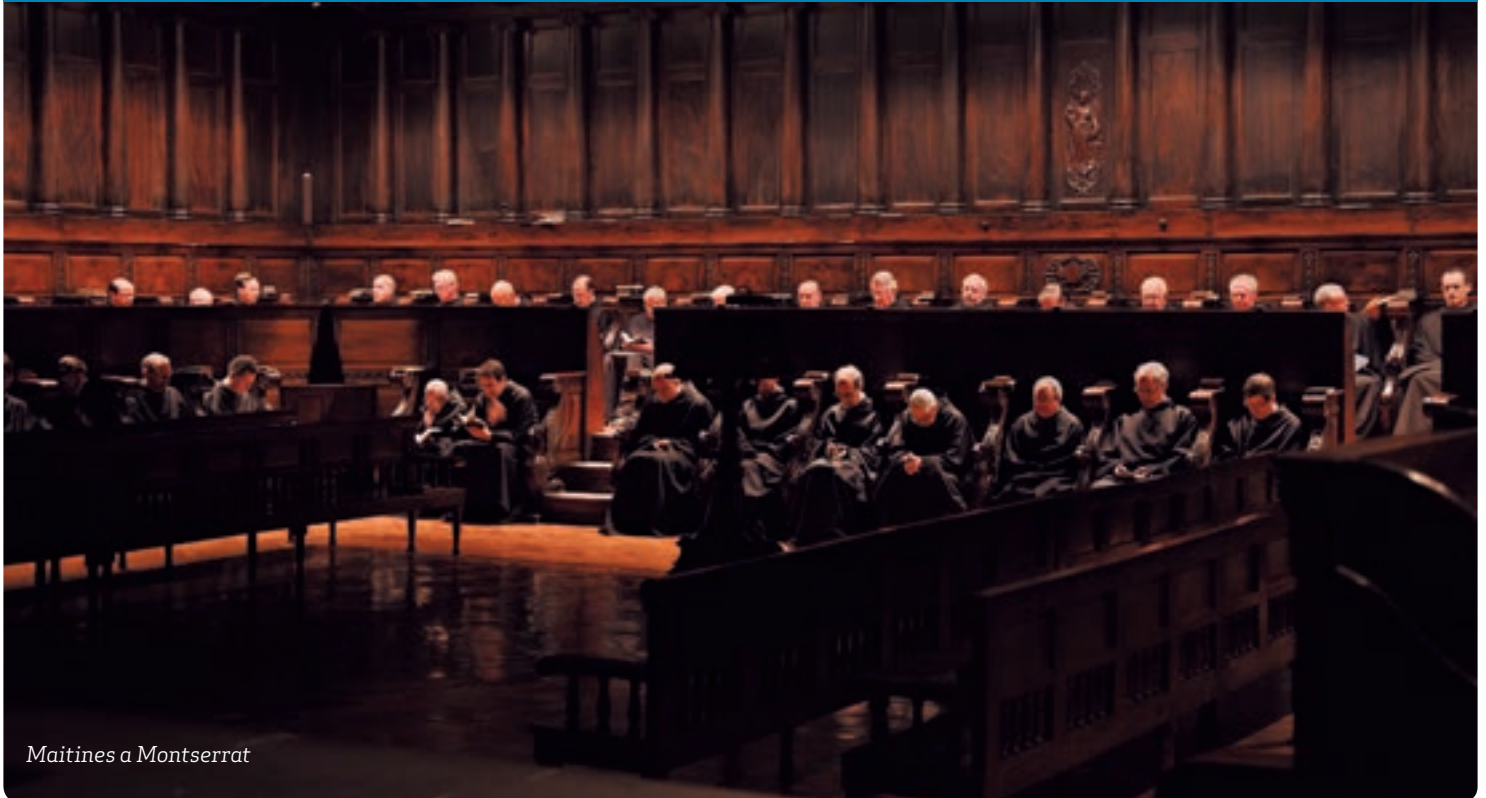
Maitines a Montserrat

p6 —Bisbes, religiosos i Càritas mostren preocupació per la pobresa infantil