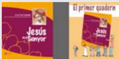
Catecisme + el Primer Quadern