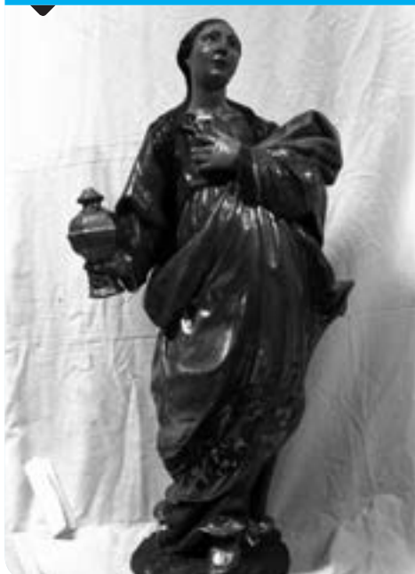
Santa Magdalena del Soler Calonge de Segarra.

Coneixent la voluntat de Déu, de vegades li diem que sí i d'altres li diem que no. El que importa és el que acabem fent. A Déu no l'eganyarem amb paraules, el que compta són els fets. La pecadora penedida passà al davant dels qui es professaven fidels.