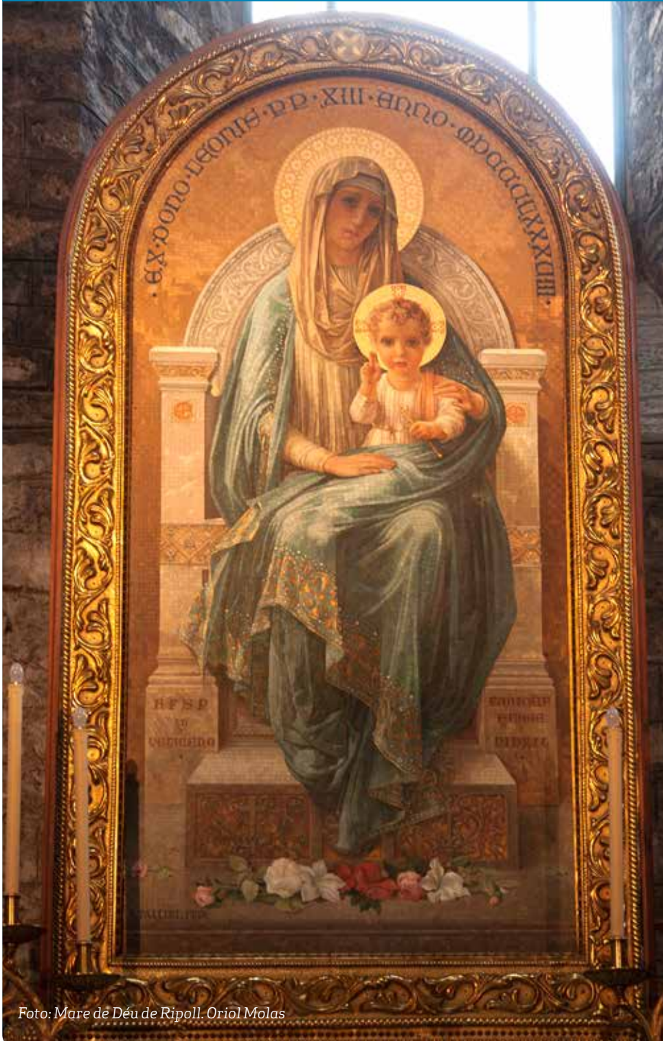
Foto: Mare de Déu de Ripoll.

Avui convidem a la pregària dels goigs del nostre gran poeta Mn. Jacint Verdaguer: «De la pàtria bella aurora, / que per Ripoll nos isqué: / de Catalunya Senyora, / feu reflorir nostra fe. / En aquesta confluència / de torrents i de camins, / font d'amor i de clemència / espereu els pelegrins. // Dels malalts sou guaridora, / sou consol de qui no en té: / De la pàtria...»