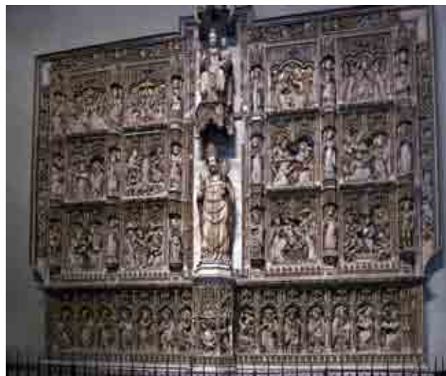
Retaule de Pere Oller

Però sens dubte el que fa més cèlebre la catedral de Vic és la seva decoració pictòrica, obra del famós muralista Josep Maria Sert per encàrrec del bisbe Torras i Bages. Com és sabut, el primer projecte, executat entre 1926 i 1930, desaparegué en cremar la catedral l'any 1936, de manera que Sert reemprengué la decoració del temple, que s'inaugurà per segona vegada en 1945. El tema fonamental de les pintures és la redempció, del pecat original als temps apostòlics, culminant a la contrafaçana occidental i a l'absis amb la passió, enterrament i ascensió de Jesucrist. Sert adoptà la tècnica de la grisalla, treballant amb colors negres, daurats i vermellors per donar a les ja dramàtiques escenes un volum i una profunditat extraordinàries. El resultat és un conjunt pictòric excepcional, que testimonia la importància de la catedral de Vic en el panorama de l'art religiós català i internacional.