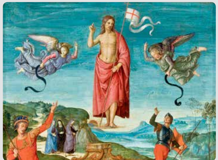
Fragment de «La resurrecció de Jesucrist» de Raphael.

La Pasqua dona com a fruit, en el cor i en la vida del qui creu en Crist ressuscitat, el testimoniatge, la missió, l'evangelització. Crist mort i ressuscitat és la notícia que mai no pot deixar de ser present en la paraula i en les obres del cristià. El papa Francesc ens recorda en l'exhortació Evangelii gaudium quin és aquest anunci: «Jesucrist t'estima, va donar la vida per salvar-te, i ara és viu al teu costat cada dia, per il·luminar-te, per enfortir-te, per alliberar-te» (núm. 164).