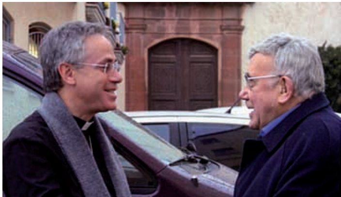
Rebuda del senyor bisbe per part del rector de la parròquia