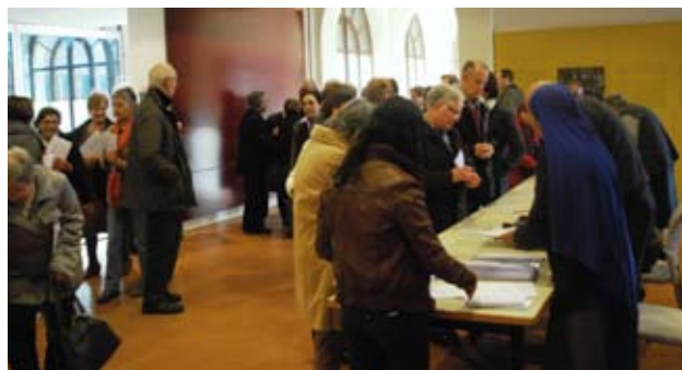
Curs animadors litúrgics 2012