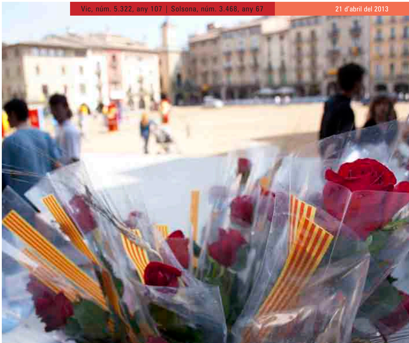
Fotolocal / Oriol Molas