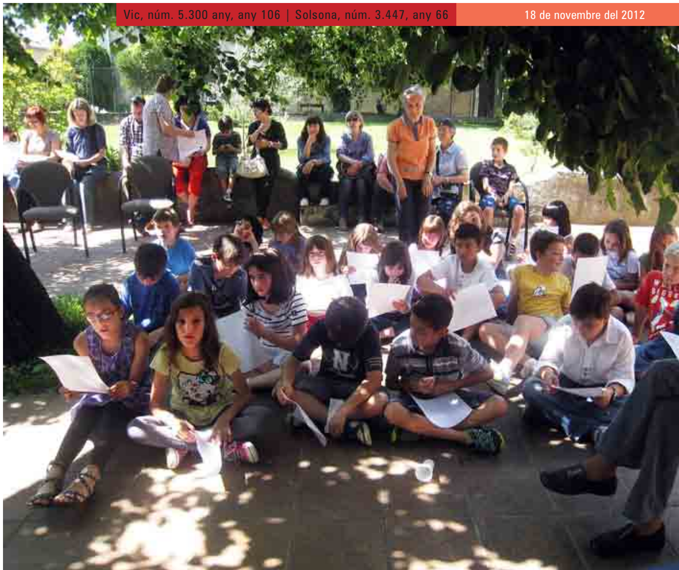
Festa de la catequesi a Ripoll