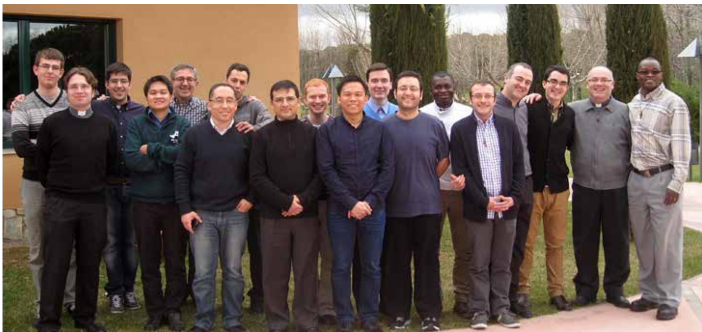
Seminaristes de l'interdiocèsà durant els Exercicis Espirituals