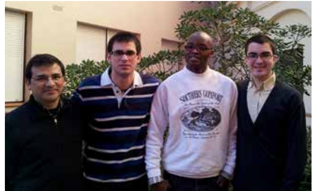
Seminaristes de Vic i Solsona

He de confessar, però, que no sempre he sabut veure l'alegria en aquest camí. Sobretot abans d'emprendre'! Quan discernia si entrar o no al Seminari, veia els preveres que coneixia i pensava: «Són feliços i estan alegres!» Però les contradiccions que hi havia dins meu m'impediën que jo visqués igual que ells pensant en la possibilitat de ser prevere en un futur. Certament, entrar al Seminari no és una decisió fàcil de prendre, ja que sempre comporta renunciar i deixar coses. En