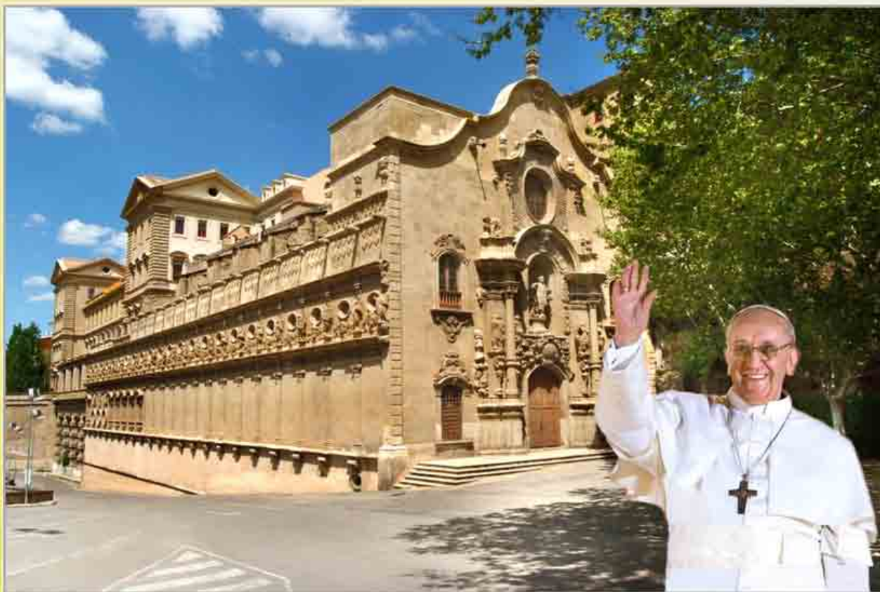
SANTUARI DE LA COVA DE SANT IGNASI