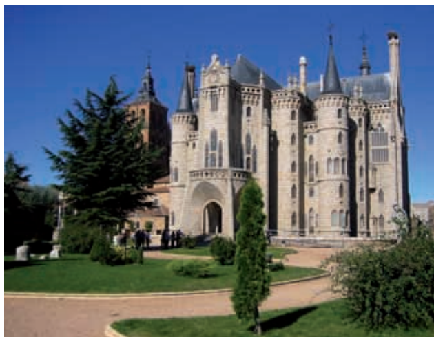
Antic Palau Episcopal d'Astorga, d'Antoni Gaudí. Actualment, Museo de los Caminos

Diumenge 8 de juliol: El Acebo - Ponferrada (13 km).