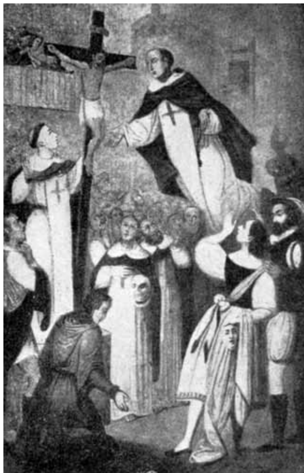
Una de les cares de l'estendard exhibit a Roma el dia de la canonització. Es guardava a la catedral de Vic. Fou destruït l'any 1936

A la magna processó de la tarda, contemplada per una gentada que en dificultava el pas, hi figuraven el pendó principal portat pel governador civil com a delegat reial, el gran estendard vaticà que calgué confiar a sis homes, el reliquiari de plata amb un os del sant i l'antiga imatge de sant Miquel de l'altar dels Trinitaris que era duta sota tàlem.