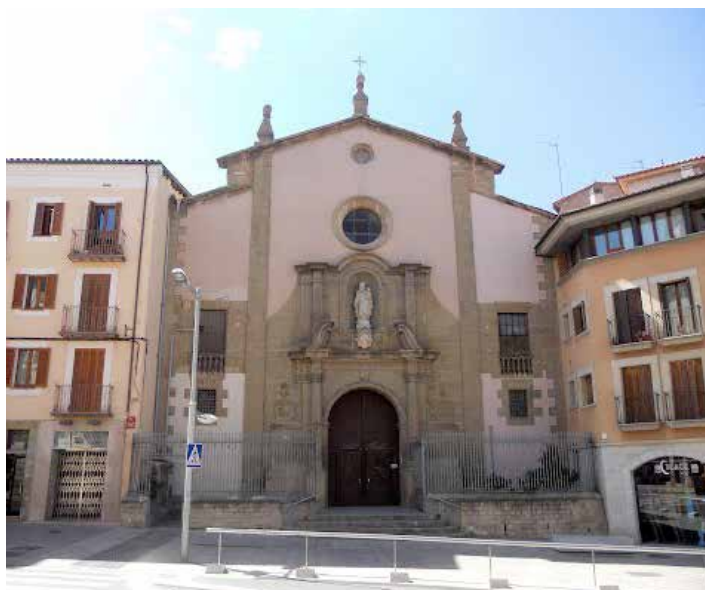
Parròquia del Carme, Vic

Acabada la missa i les salutacions, el rector ens oferí un àpat fraternal, que ja tingué gust de Nadal; a la seva residència i cuinat per ell mateix.