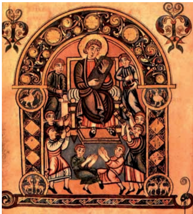
El rei David i els salms