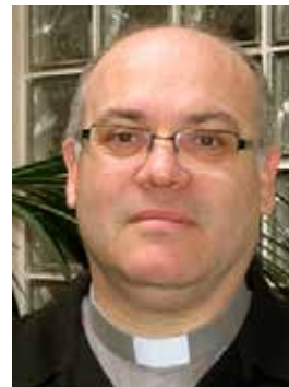
Mossèn Norbert Miracle

Els testimonis de fe de la nostra terra, proclamats beats o sants de l'Església, seran un bon esperó, i alhora intercessors, per a respondre avui a la crida que Déu ens fa a la santedat, ben atents a les necessitats dels temps actuals.