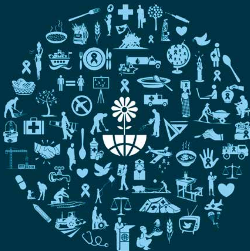
Fragment del cartell de Mans Unides per la campanya contra la fam.