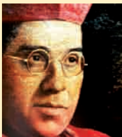
Salvi Huix i Miralpeix, bisbe Sant Hilari Sacalm, 1877 / Lleida, 1936

El 13 d'octubre provinent tindrà lloc a Tarragona una magna beatificació: 522 beats relacionats amb la persecució religiosa ocorreguda en el temps de la revolució i guerra civil espanyola (1936-39). A les dotze del migdia se celebrarà una missa de beatificació, presidida pel cardenal Angelo Amato, legat del Sant Pare, en el Complex Educatiu (antiga Universitat Laboral de Tarragona). En els pròxims dies anirem publicant les biografies dels beats relacionats amb la diòcesi de Vic.