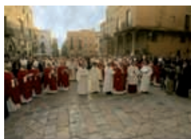
Jaume Pujol Balcells