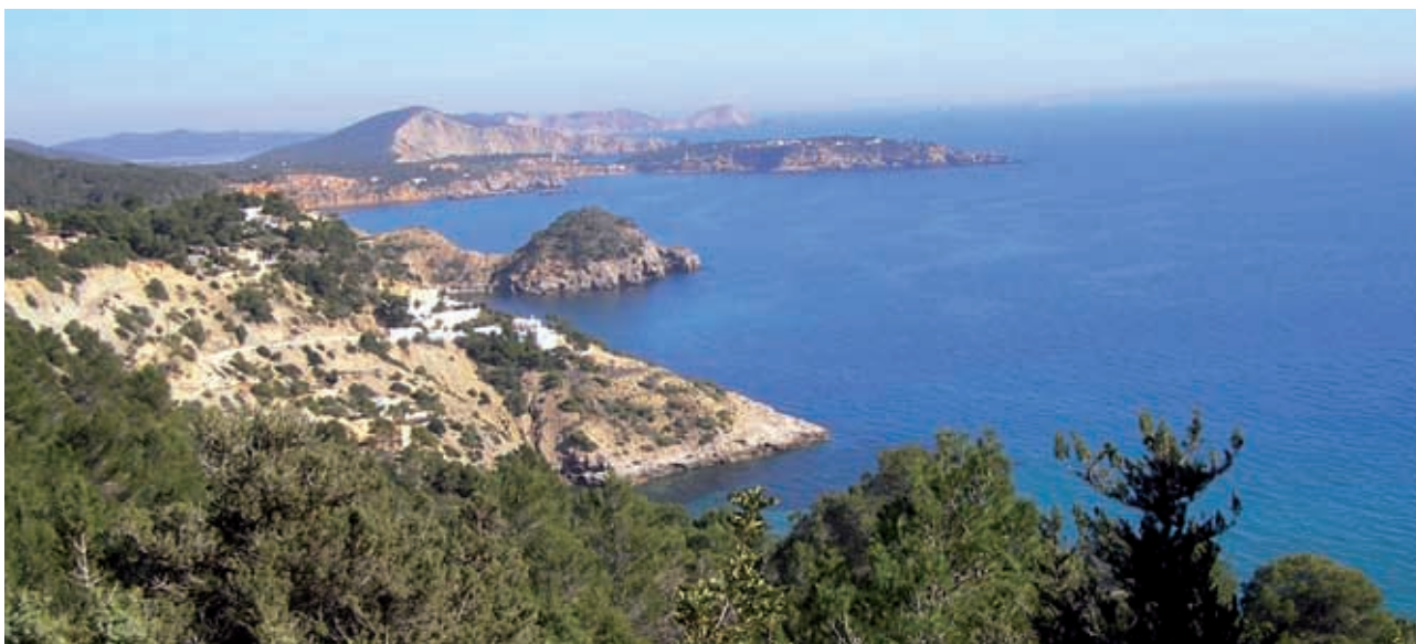
Des del mirador des Cubells (Eivissa).

una habitació, una església, o la natura mateixa), el silenci d'admiració (el que ens sobrevé davant un fet extraordinari, gran o petit: una posta de sol, una petita flor, una obra d'art), el silenci d'amor (el de la comunió i la comunicació profundes), el silenci de dolor (el del sofriment, el de la mort, el del Misteri) i el silenci buit (el del desamor, l'egoisme i la indiferència).